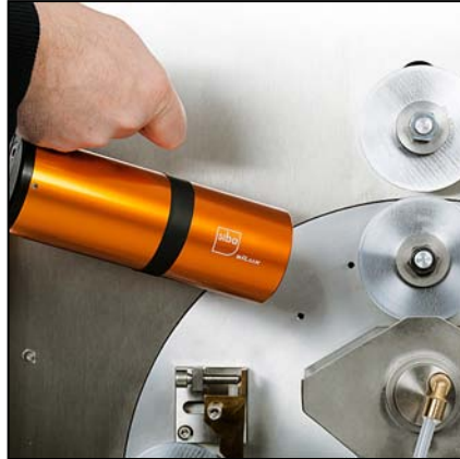
Si20 avec lampe stroboscopique SiLux