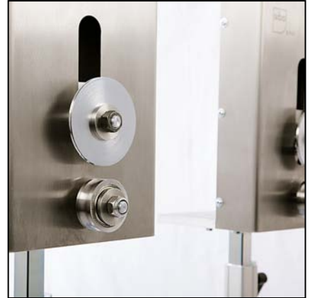
Unité de gaufrage Si P10 Egalement disponible en version économique pour le marquage à l'encre